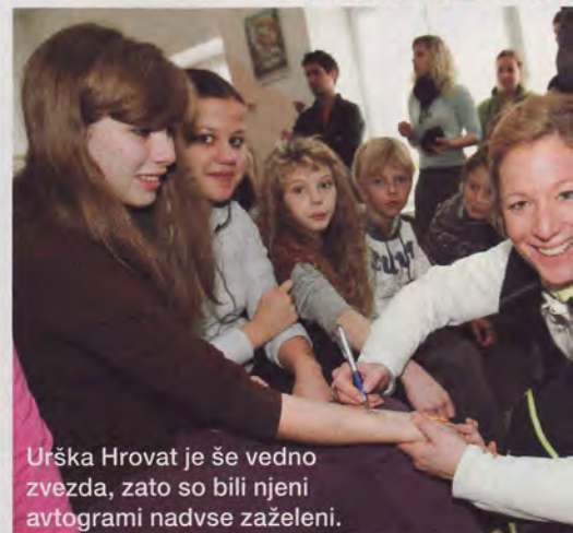
Urška Hrovat je še vedno zvezda, zato so bili njeni avtogrami nadvse zaželeni.